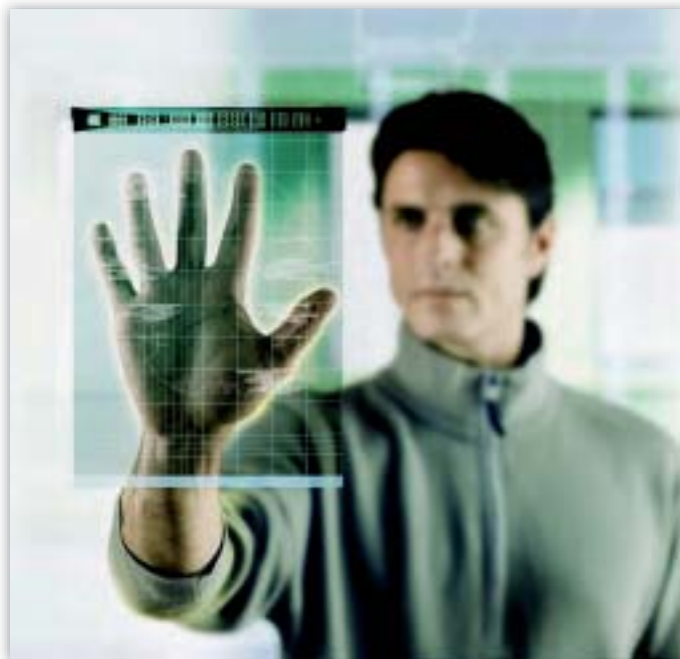
Euroopan tietosuojavaltuutetun tehtäviin kuuluu tietosuojaan mahdollisesti vaikuttavan uuden teknologian kehittämisen seuraaminen.

Euroopan tietosuojavaltuutettu piti myönteisenä vuonna 2006 julkaistua komission tiedonantoa ”Turvallisen tietoyhteiskunnan strategia” (46) ja siinä esitettyä näkemystä: ”täysin yhteenliitetty ja verkotettu arkielämä lupaa merkittäviä mahdollisuuksia. Mutta se luo myös uusia turvallisuuteen ja yksityisyyden-