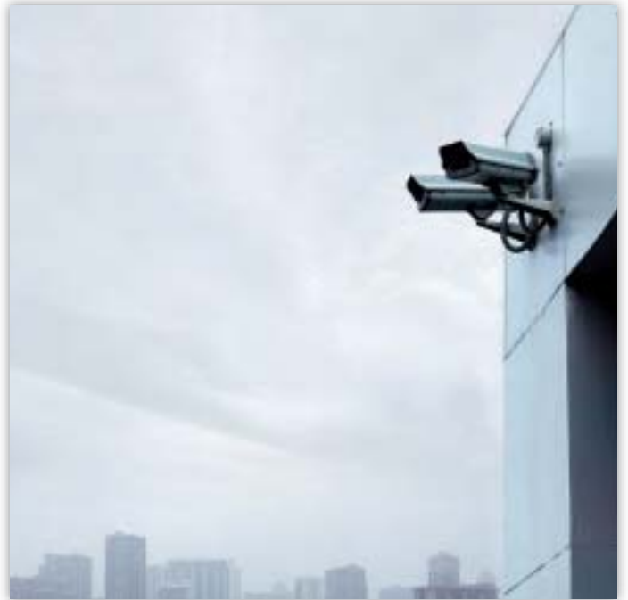
Valvontakameroita on lisätty viime vuosina.

Euroopan parlamenttia vastaan tehtiin kantelu (2006-95), joka koski akkreditoitujen lobbaajien kotiosoitteiden mahdollista julkaisemista. Lobbaajan tunnuksen saamiseksi täytettävässä lomakkeessa annettiin ymmärtää, että kotiosoitteen antaminen oli pakollista. Saman lomakkeen myöhemmässä kohdassa mainittiin, että seuraavia tietoja ei julkistettaisi, mistä