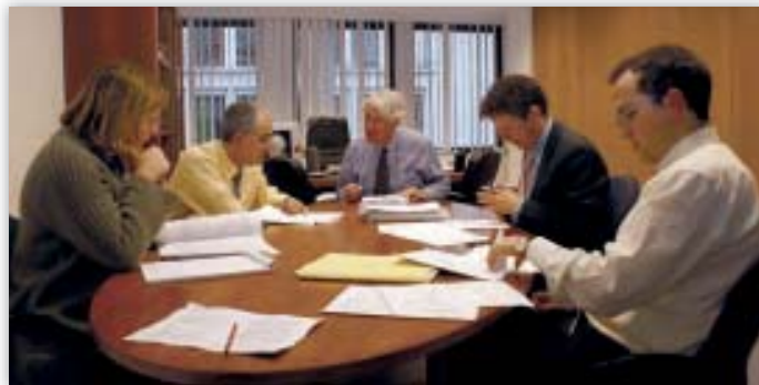
Poliittisen tiimin jäseniä viimeistelemässä lausumaa.

Tietojen laatu oli myös tärkeä horisontaalinen aihealue. Tietojen on oltava tarkkoja, jotta vältetään käsiteltyjen tietojen sisältöä koskevat epäselvyydet. Näin ollen on tärkeää tarkistaa tietojen tarkkuus säännönmukaisesti ja perusteellisesti. Tietojen hyvä laatu on perustakuu rekisteröidylle, ja lisäksi se helpottaa tietojen käsittelevien toimien tehokasta toimintaa.