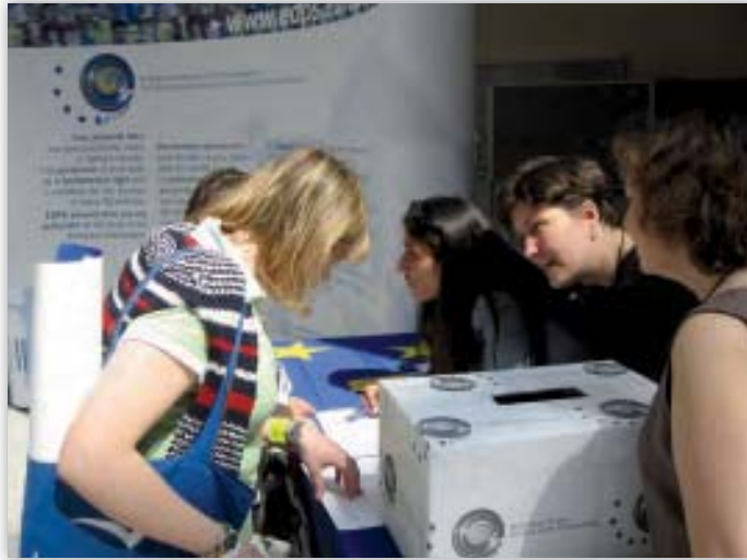
Euroopan tietosuojavaltuutetun henkilöstöä Euroopan parlamentissa avoimien ovien päivänä 6. toukokuuta 2006.

Kuten myös vuonna 2005, suurin osa pyynnöistä esitettiin englanniksi ja ranskaksi, mikä mahdollisti nopean vastaamisen, käytännössä aina alle 15 työpäivän kuluessa. Huomattava määrä pyynnöistä esitettiin kuitenkin muilla virallisilla kielillä, ja koska osassa niistä tarvittiin käännösyksikön apua, käsittely kesti pitempään. Esitettyjä pyyntöjä hyödynnetään myös Internet-sivuston sisällön kehittämisessä tietojen antamiseksi sivustolla kävijöille ja tarpeettomien tiedustelujen tai valitusten määrän vähentämiseksi mahdollisuuksien mukaan.