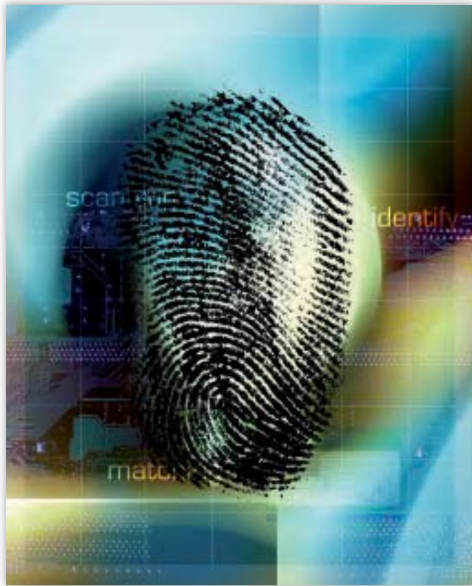
Eurodac-järjestelmä sisältää yli 250 000 sormenjälkeä.

Euroopan tietosuojavaltuutettu on myös ottanut huomioon komission julkaiseman Eurodacin toimintaa koskevan vuosikertomuksen (31) sekä komission julkaisemat tiedot, jotka koskevat järjestelmän käyttöä.